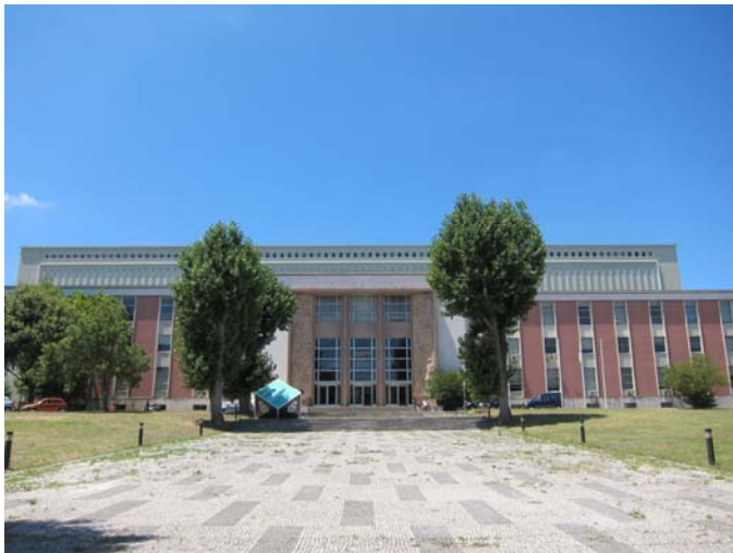
【ポルトガル国立図書館】

研究所では、私個人に専用の机や椅子が与えられているわけではなく、他の客員研究員や学生らと共用のスペースを使用しています。ただ、研究室での活動が主体となる実験系の研究とは異なり、私のおこなっている歴史学の研究は、史料そのものの収集、収集した史料の精査、関連する先行研究の読解などが主な作業ですので、研究所外にいることの方が多いです。最も頻繁に訪れているのは